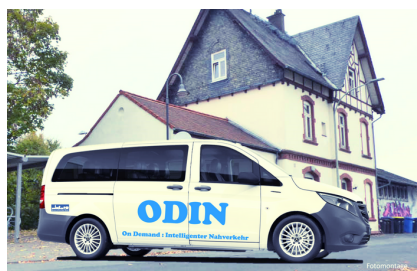
ODIN = On Demand: Intelligenter Nahverkehr

Zur Stärkung des Personennahverkehrs hatten wir einen Prüfantrag zur Einführung eines On-Demand-Shuttles für Rosbach gestellt. Aus Kostengründen scheint diese hochmoderne Alternative zu herkömmlichem Buslinienverkehr zur Zeit nicht realisierbar zu sein. Wir haben deshalb gemeinsam mit den Fraktionen von FWG und den Grünen die Prüfung eines erweiterten ÖPNV-Angebots für unsere Stadt angestoßen. Außerdem setzen wir uns für eine durchgehende Zugverbindung nach Frankfurt ein.